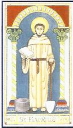
Schutzpatron der Koloproktologen